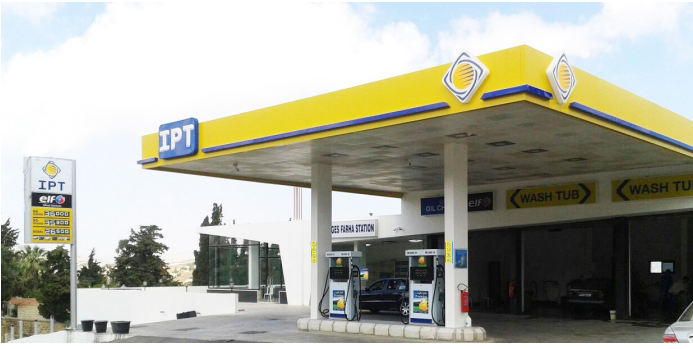
محطة جورج فرحة - مرجعيون