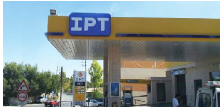
محطة مالك محمود (حاريص) - حاريص

في إطار تنفيذ الخطة التوسعية لإدارة شركة أي بي تي والتي تهدف إلى تعزيز دور محطات الخدمة في منطقة الجنوب اللبناني. جرى مؤخراً إفتتاح محطتين. الأولى في حاريص والثانية في مرجعيون. باشتر الفرعان الجديدان إستقبال زبائنهما مع توفير وتقديم كّل الخدمات التي طالما اعتادوا عليها في محطات أي بي تي حيث تتوافق جودة المنتجات مع الإلتزام بمعايير السلامة وحسن الإستقبال والتوجيه الصحيح للزبائن. يضيف هذان الموقعان إلى التصميم العصري والجذاب لمحطات أي بي تي. تأمين الراحة للزبائن عبر توفير باحات استراحة مريحة داخل المحطة. وبإفتتاح المحطتين المذكورتين تثبت أي بي تي مجدداً أنّها مؤسسة لبنانيّة متجدّرة وأنّها لكلّ لبنان وخدمة جميع اللبنانيين من كلّ المناطق وتخصّصهم بخدمات عصرية متجدّدة دوماً.